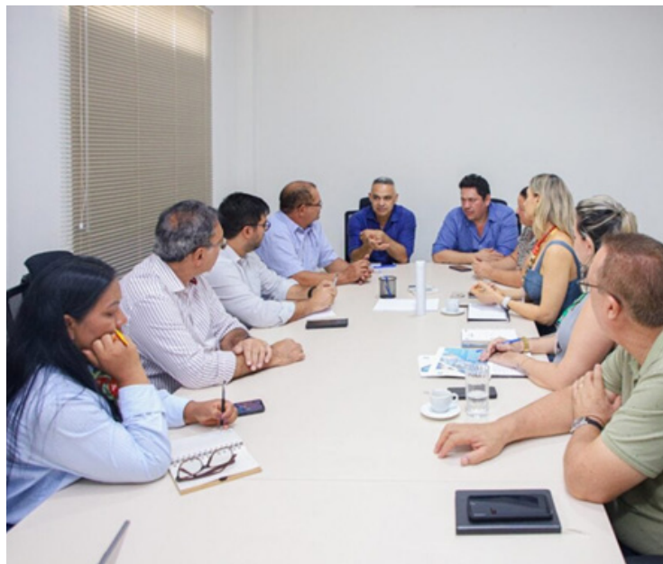
Primeira reunião anual do Cegecon.

Também realizamos nossa primeira reunião anual do Comitê Estadual de Gestão de Convênios (CE-GECON). O Cegecon é o órgão colegiado responsável pela coordenação das ações de planejamento e gestão de convênios no âmbito do Governo do Acre e durante a reunião anual do Comitê foram discutidos temas estratégicos relacionados à execução dos recursos federais.