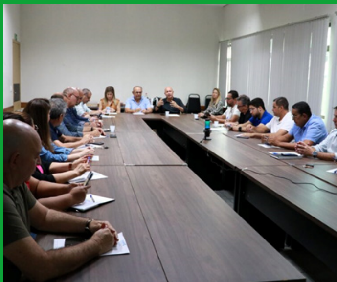
Equipes da Dircam e do Banco Mundial.

Em abril, nós recebemos a equipe do Banco Mundial para a primeira missão de supervisão do Programa de Sustentabilidade Fiscal, Eficiência e Eficácia do Gasto Público (Progestão) desde a formalização do acordo em maio de 2024. Durante três dias foram realizadas uma série de reuniões com a participação de todos órgãos co-executores do programa no Estado do Acre.