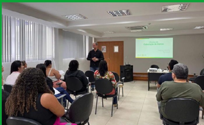
Oficina de Concessão de Diárias.